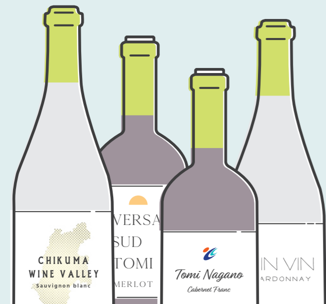
企画・監修 東御ワインクラブ