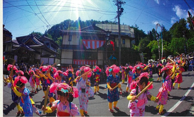
ささら踊り(岳の幟)