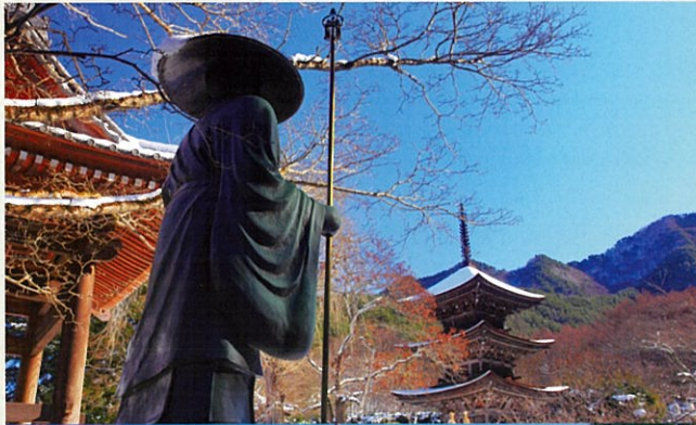
弘法大師ゆかりの前山寺