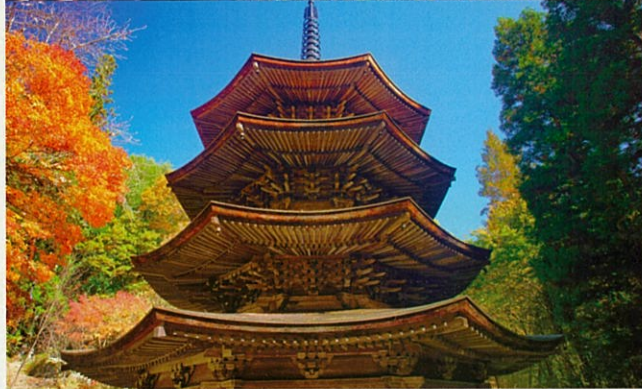
安楽寺八角三重塔