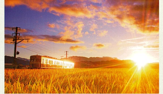
レイラインに沿って走る別所線