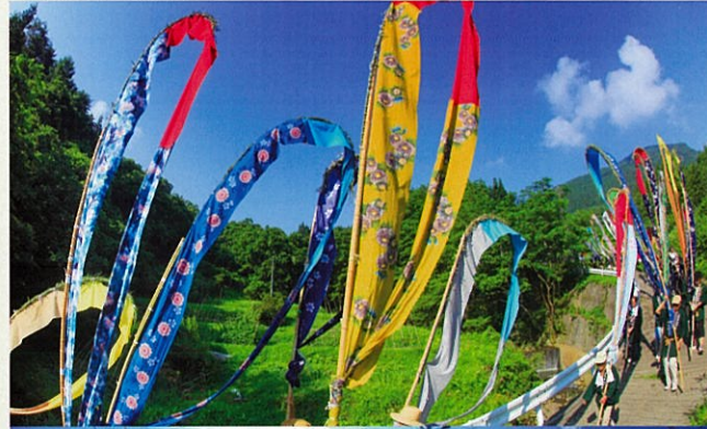
別所温泉の岳の幟行事