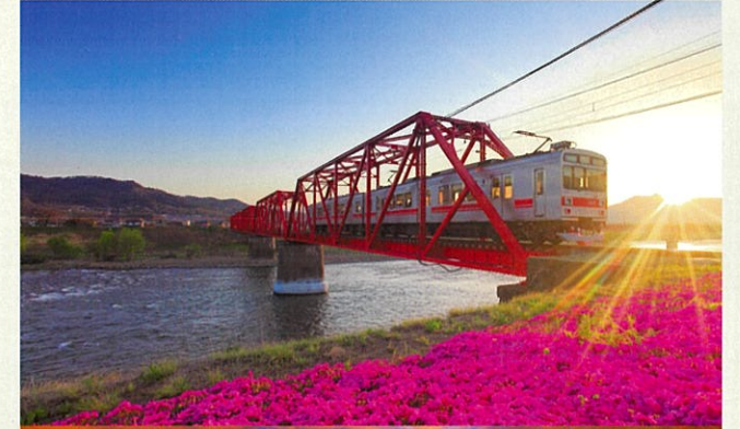
別所線の千曲川橋梁