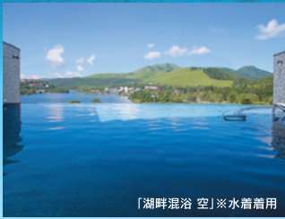
「湖畔混浴 空」※水着着用

※小学生(大人料金の70%) 3歳から小学生未満(大人料金の50%) 3歳から小学生未満4,400円税込(食事あり・寝具なし・特典なし) 0～2歳無料(食事・寝具なし) ※お部屋のタイプは洋室又は和洋室となります。 ※夕食・朝食共にレストランにて、ビュッフェのお食事となります。 ※ファミリーランド営業4/20～11/17